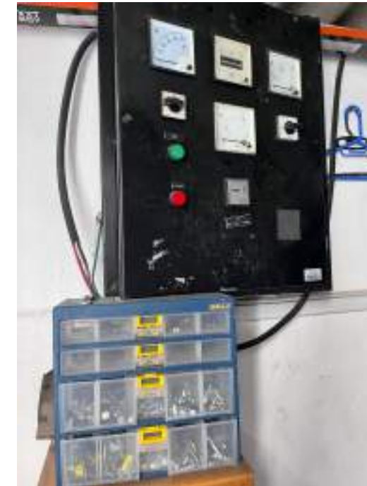
Instalación bomba presión agua de calentador